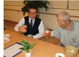
ハンアルコール ビールで乾杯!