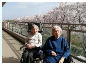
4月の桜の頃 ベランダでお花見